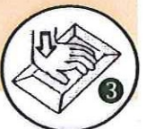
PLIAGE DE LA BRIQUE

LES DECHETERIES DE SARREGUEMINES, WOUSTVILLER ET ROUHLING SONT A VOTRE DISPOSITION POUR VOS DECHETS LOURDS, VOLUMINEUX ET DANGEREUX.